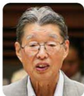
森 眞一 議員